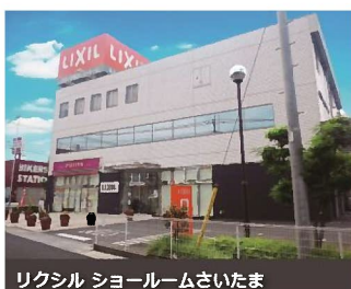
リクシル ショールームさいたま